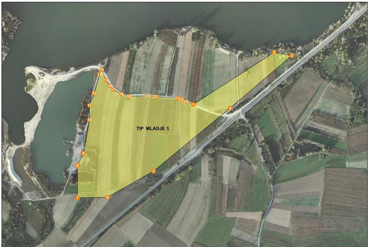
Grafički prikaz traženog istražnog prostora građevnog pijeska i šljunka “Mladje 1”